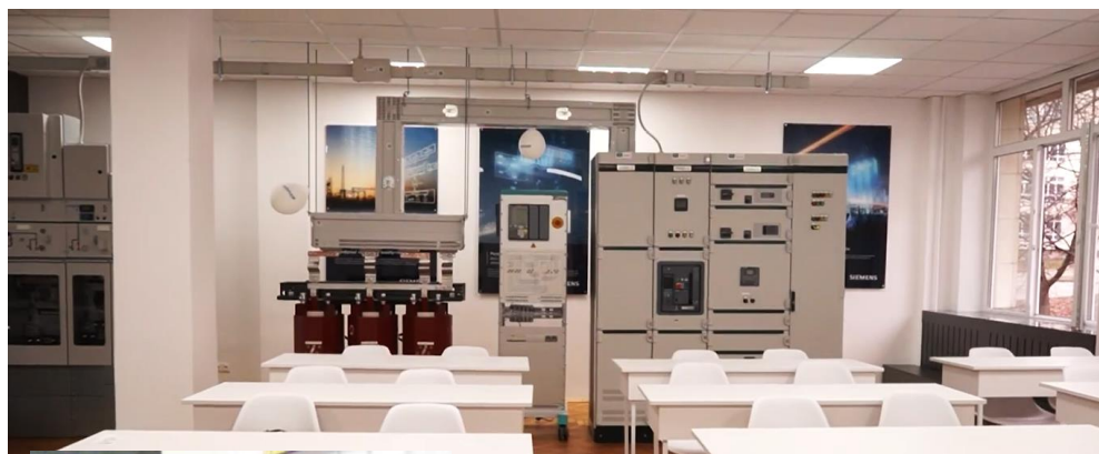
Лабораторія SIEMENS з цифровою підстанцією 6-20/0,4 кВ (к.115-20).

Кафедра готує фахівців для створення та супроводження сучасних комплексів захисту, автоматики, інформаційного забезпечення та управління виробництвом, передачею і розподілом електроенергії.