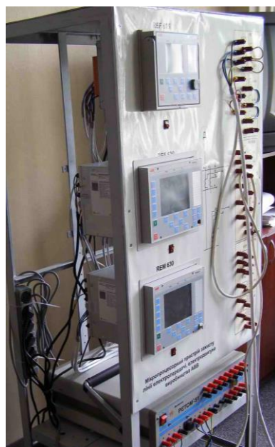
Лабораторія релейного захисту та автоматики (к. 305-20)